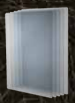
5 x स्क्रीन प्रोटेक्टर