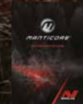
शुरू करना मार्गदर्शिका